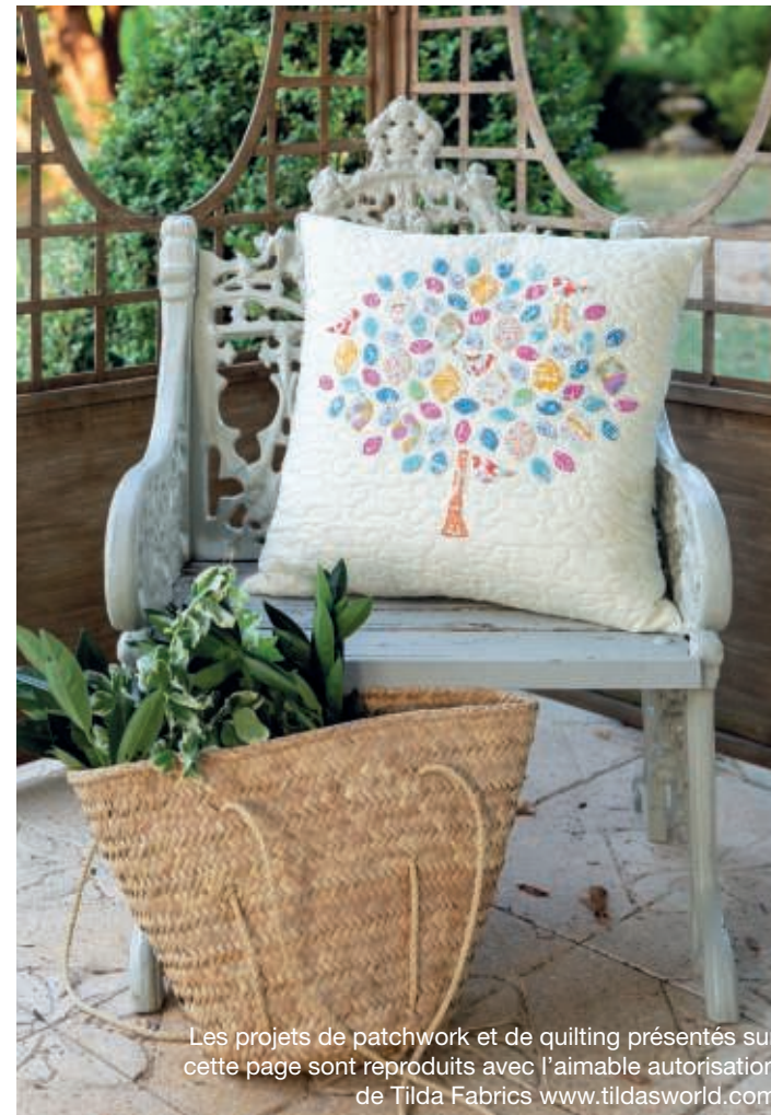
Les projets de patchwork et de quilting présentés sur cette page sont reproduits avec l'aimable autorisation de Tilda Fabrics www.tildasworld.com