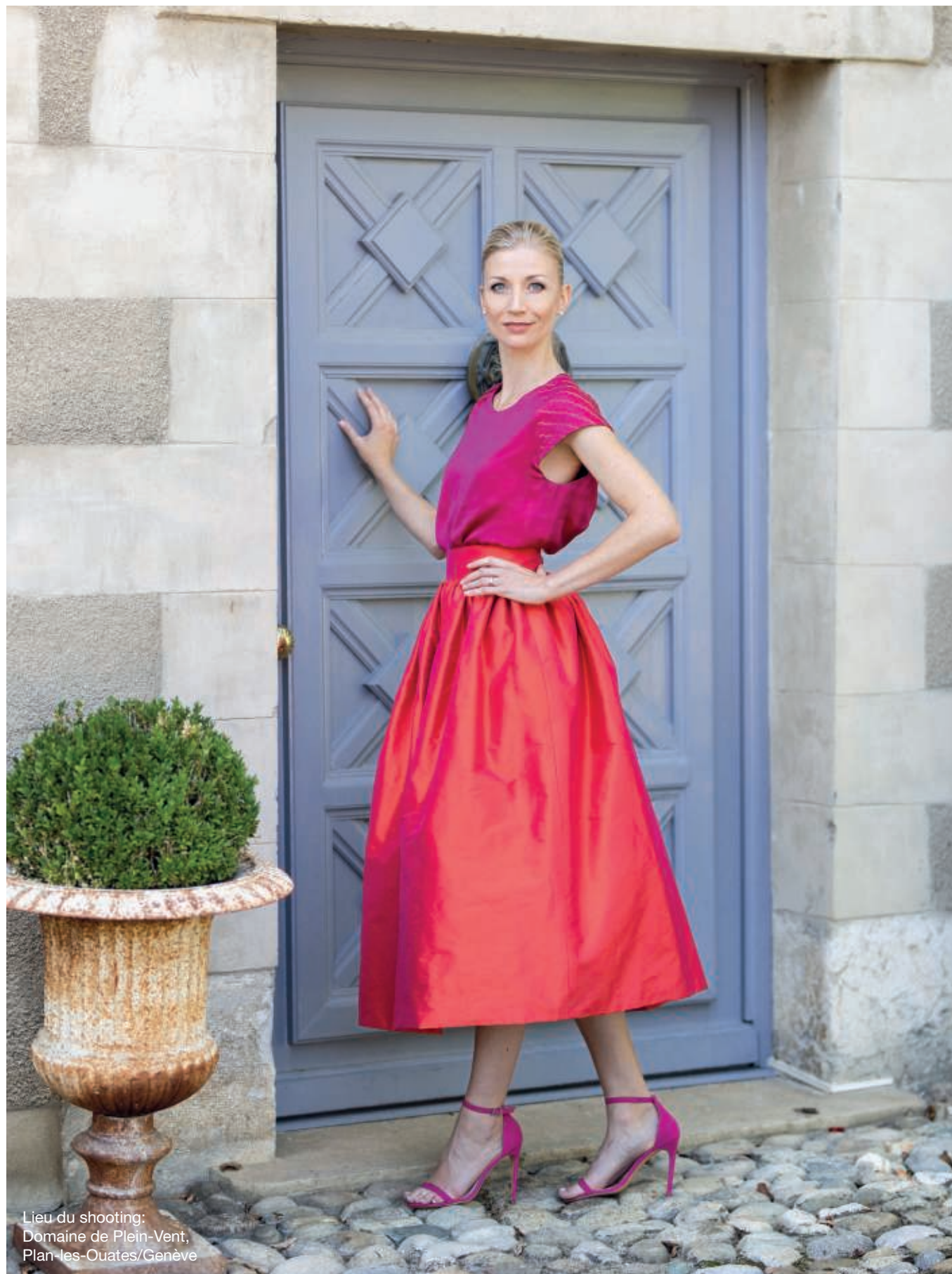
Lieu du shooting: Domaine de Plein-Vent, Plan-les-Ouates/Genève