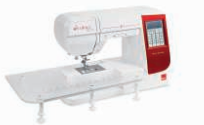
TABLE D'EXTENSION EXTRA-LARGE

Fournie avec nos modèles eXcellence, la table d'extension extra-large vous offre un espace de travail étendu pour réaliser des projets d'envergure (non comprise avec l'eXcellence 770).